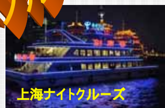
上海ナイトクルーズ