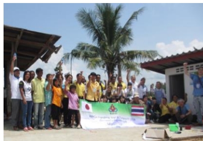
工事完了後みんなで記念撮影