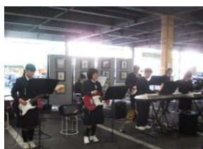
半田特別支援学校生徒による演奏

アピタ刈谷店で、あいおいニッセイ同和損保の皆さん、愛知県立半田特別支援学校桃花校舎の生徒さんとともに、「Make a Change Day ～1年に1日、ボランティア・市民活動を行う日～」を開催しました。「子ども免許作り」「ワイヤーアート教室」、また生徒さん達による作品展や演奏も行いました。来店した方も作品を手にとり見て、演奏に聞き入っていました。