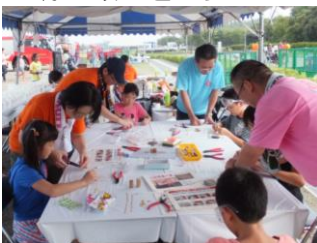
ワイヤーでのカードスタンド作り (阿久比ファミリーフェスタ)

デンソー関連イベントではデンソー阿久比製作所、大信精機、浜名湖電装のイベントに出展しました。来場者の方々に、チャリティ商品販売やワイヤーアート教室を楽しんでいただきました。また、ジョイちゃんに続く「タイ ピムちゃん自宅バリアフリー募金」でも多くの方にご寄付をいただき、6万円の目標金額を達成することができました！