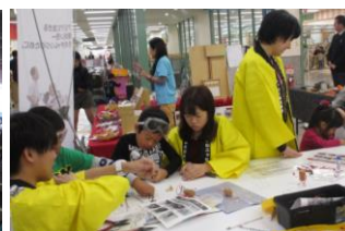
あいおいさんによるワイヤーアート教室