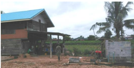
工事前のジョイちゃん宅全景 (左:母屋 右:トイレ)

「WAFCAレポート39号」等で寄付を呼びかけた「ジョイちゃん自宅のバリアフリー支援(10万円)」。すべての工事が無事に終わりました!