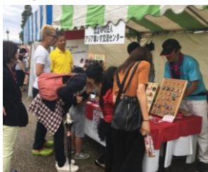
チャリティ商品販売 (大信フェスタ)

アピタ刈谷店で、あいおいニッセイ同和損保の皆さん、愛知県立半田特別支援学校桃花校舎の生徒さんとともに、「Make a Change Day ～1年に1日、ボランティア・市民活動を行う日～」を開催しました。「子ども免許作り」「ワイヤーアート教室」、また生徒さん達による作品展や演奏も行いました。来店した方も作品を手にとり見て、演奏に聞き入っていました。